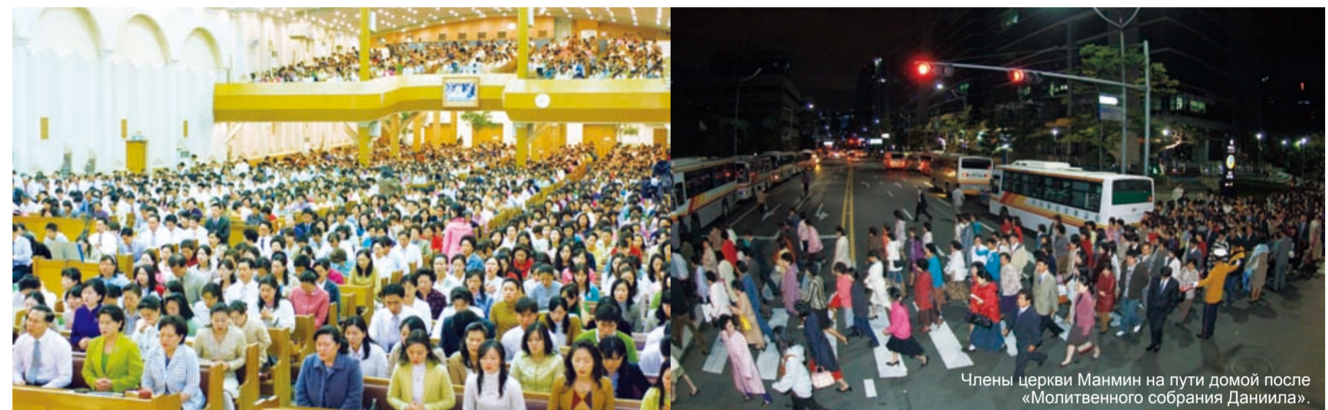
Члены церкви Манмин на пути домой после «Молитвенного собрания Даниила».